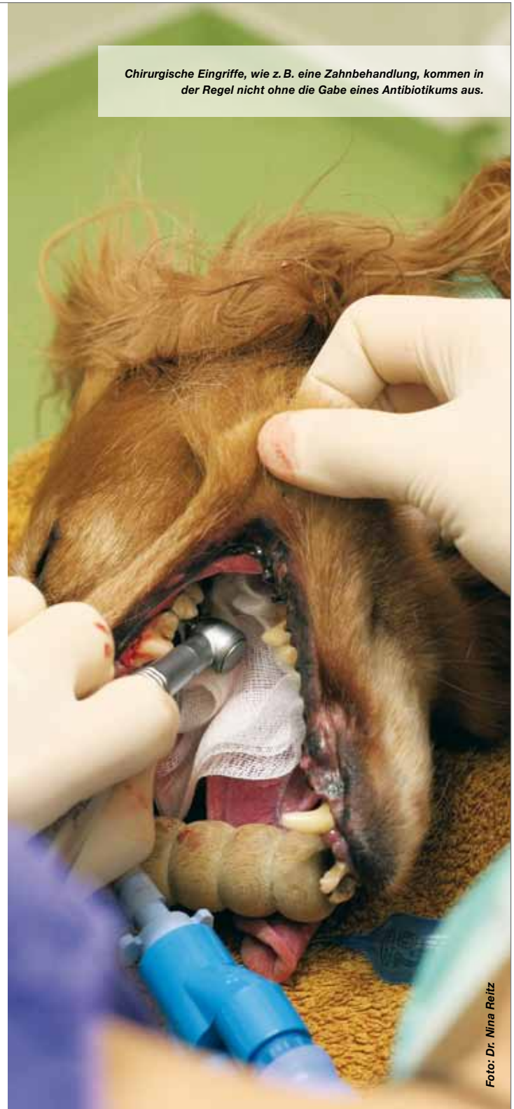
Chirurgische Eingriffe, wie z. B. eine Zahnbehandlung, kommen in der Regel nicht ohne die Gabe eines Antibiotikums aus.